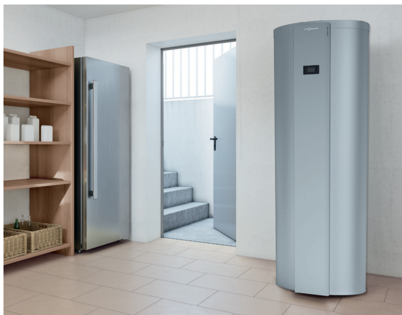
Bomba de calor de agua caliente Vitocal 262-A (modelo T2H)

La versión eléctrica (modelo T2E) viene equipada de fábrica con resistencia eléctrica seca de apoyo. La versión híbrida con intercambiador de calor (modelo T2H) también puede ser reequipado con resistencia eléctrica de apoyo. La conexión seca protege contra la calcificación y no es necesario vaciar el tanque de almacenamiento cuando deba reemplazarse la resistencia eléctrica de apoyo.