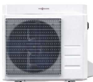
Vitocal 100-A entre 6 y 8 kW

Amplio rango de potencias disponible tanto en frío como en calor