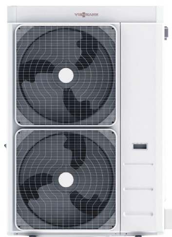
Vitocal 100-A entre 14 y 16 kW