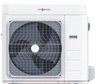
Vitocal 100-A entre 10 y 12 kW