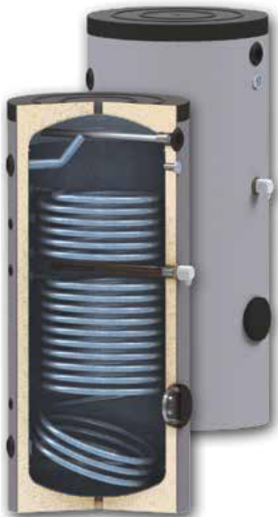
La resistencia eléctrica de apoyo se suministra como opción