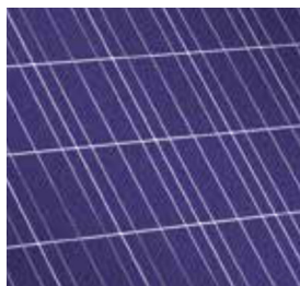
Módulo fotovoltaico Vitovolt 300